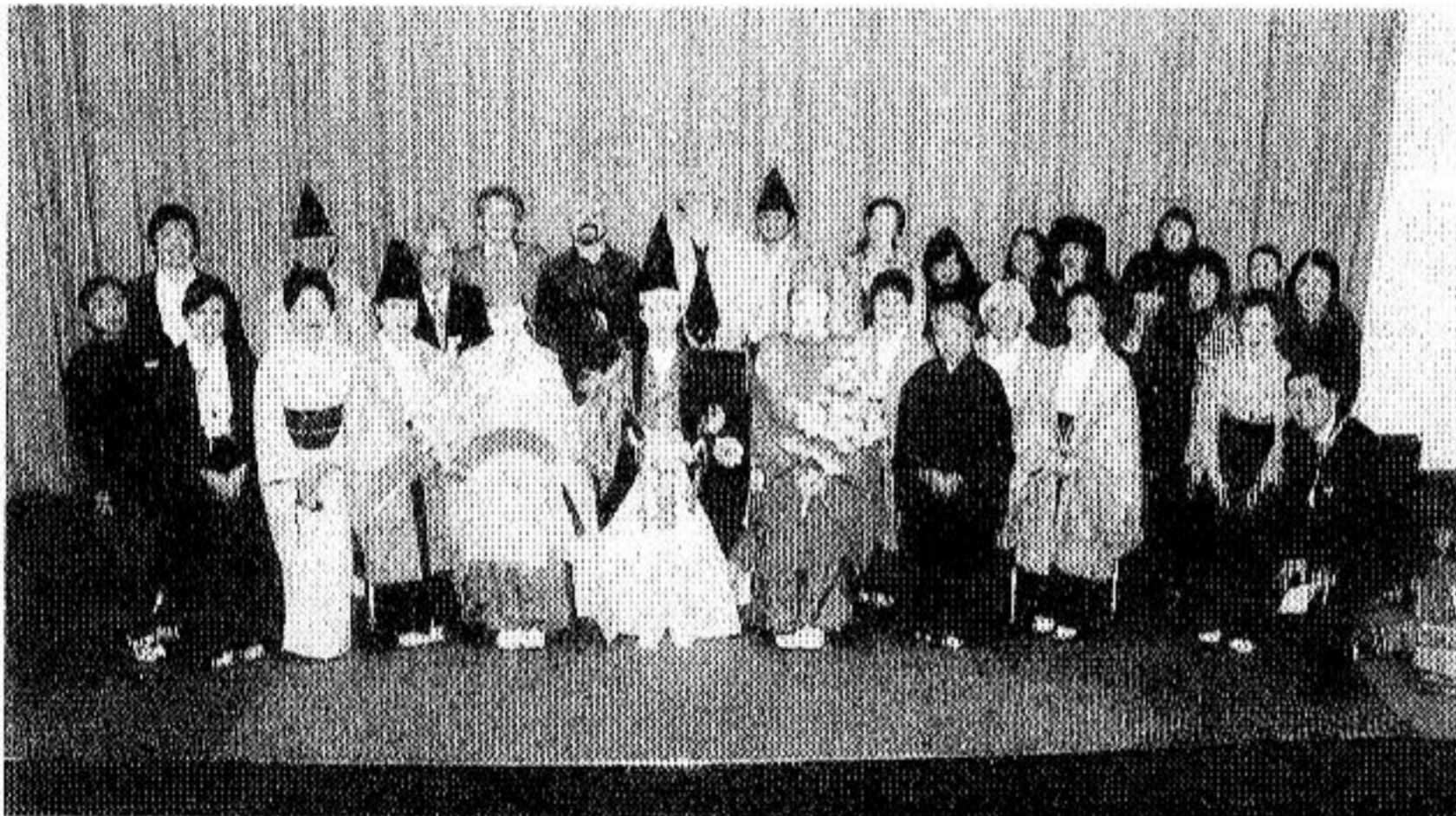
金光教国際センター http://www.konkokyo.or.jp/eng/kic/

ウ先生が、吉備楽や中正楽の解説だけではなく、金光教の成り立ちや教義も説明して下さいました。私たちにとってはロンドンの学識者が、金光教のお道を語って下さり、とても意義深いものになりました。更に詳しい報告は、近日中に国際センターのホームページにアップ致します！ (国際センターのホームページより抜粋)